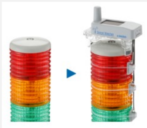
後付けセンサで表示灯状況をEnOceanで送信

・MC稼働状況の収集を、GrovePiの光センサまたは、EnOceanセンサにする方向で検討