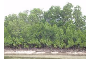
マングローブ林の復活