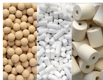
ボール ペレット リング