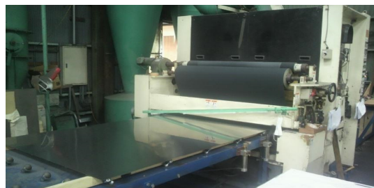
&lt; 高速研磨機 &gt;