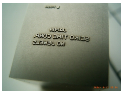
<超硬への精密彫刻>