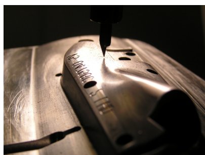
<自由曲面に文字彫刻>