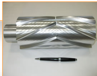
ローター刃 材質 AL5052