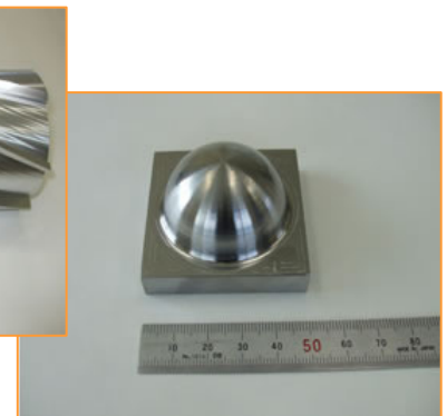
球面加工 材質 NAK55