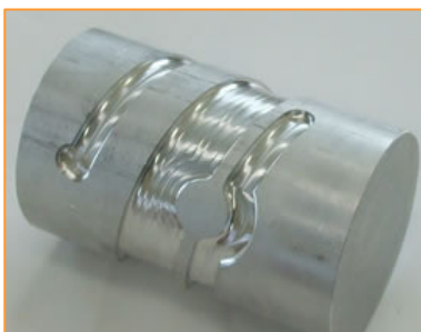
円筒側面加工 材質 AL5052

マシニングセンターでは単品、治工具や金型部品などの加工をしており、 0.01\sim 0.05\text{mm} の精度の加工を得意としています。インデックスを使用した多軸加工により円筒側面の加工もXY平面に展開し、高能率に加工します。