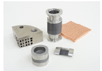
<3D構造体、微細3D積層構造体製作例>