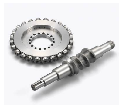
減速機タイプローラーギヤ