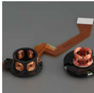
＜ステータ立体タイプ＞