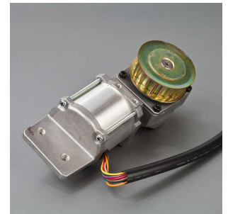
＜自動ドア用モーター＞