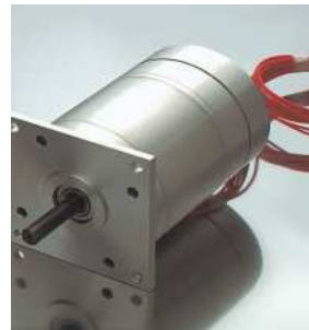
＜リラクタンスモーター＞