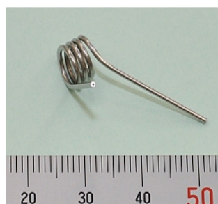
<パイプ・ワイヤー アッセンブル加工品>

複合旋盤(20台)、5軸マシニングセンタ(10台)、ワイヤ放電加工機(10台)などを駆使し、超精密加工を提供しています。