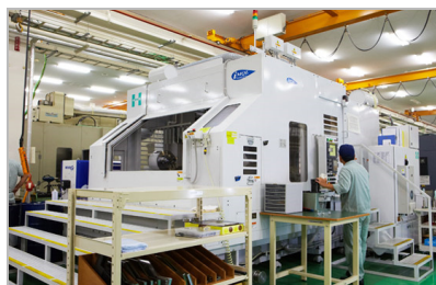
<IMQL 工法による高速油穴加工機>