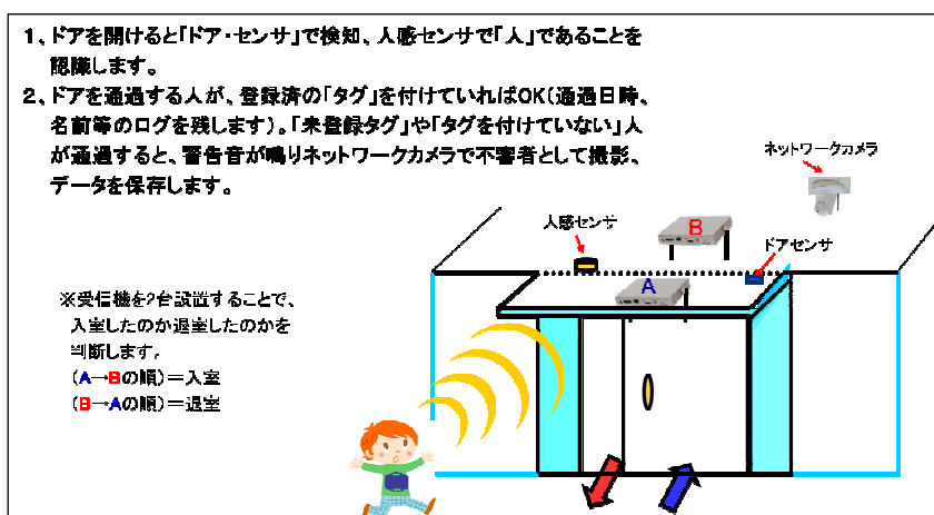
&lt;入退室管理システム&gt;